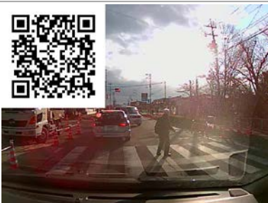
横断歩道は歩行者優先です