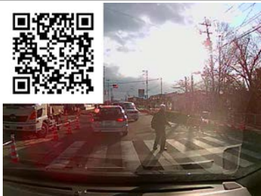
横断歩道は歩行者優先です