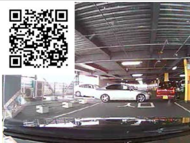
そんなに急がなくても・・・