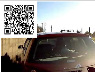
年末だと言うのに・・・