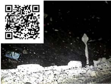
初雪にて、さっそくやらかしました ( T D T )