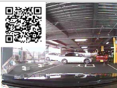
そんなに急がなくても・・・