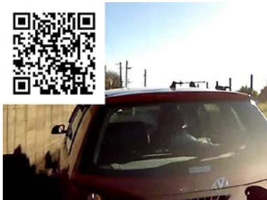
年末だと言うのに・・・