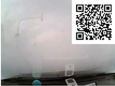
北海道の田舎道は怖い