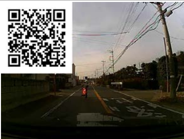
子供は飛び出すものと思え！