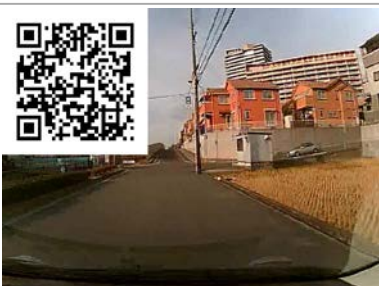
一時停止無視の車にあわや衝突の危機