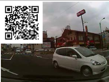
一刻一秒を急いでいることもあります